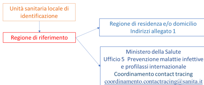
Figura 1 Flow chart dei flussi di comunicazione tra Regioni e Ministero della salute

Per facilitare le comunicazioni si chiede di apporre come inizio dell'oggetto la dicitura CT_NAZIONALE e di riportare sempre le seguenti informazioni: