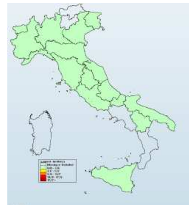
Rapporto Epidemiologico Influnet n.7. Stagione 2020/2021

L'incidenza settimanale delle Sindromi Influenzali (ILI) in Piemonte è di 1,8 casi per 1000 assistiti. Nella settimana corrispondente della scorsa stagione, l'incidenza era più che doppia rispetto alla stagione attuale.